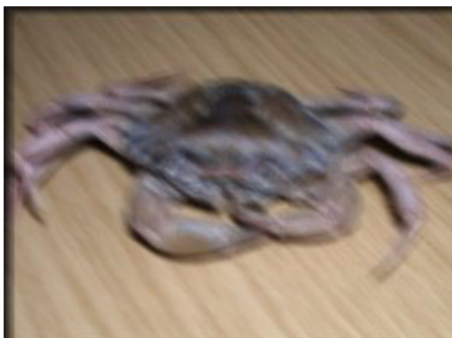
Imagen deformada, A